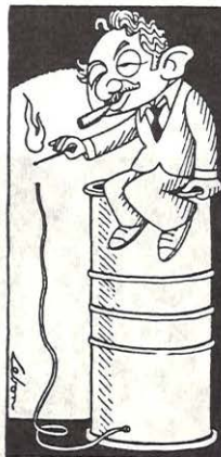
(Dessin de Lalou, L'Aurore 3.1.1978).