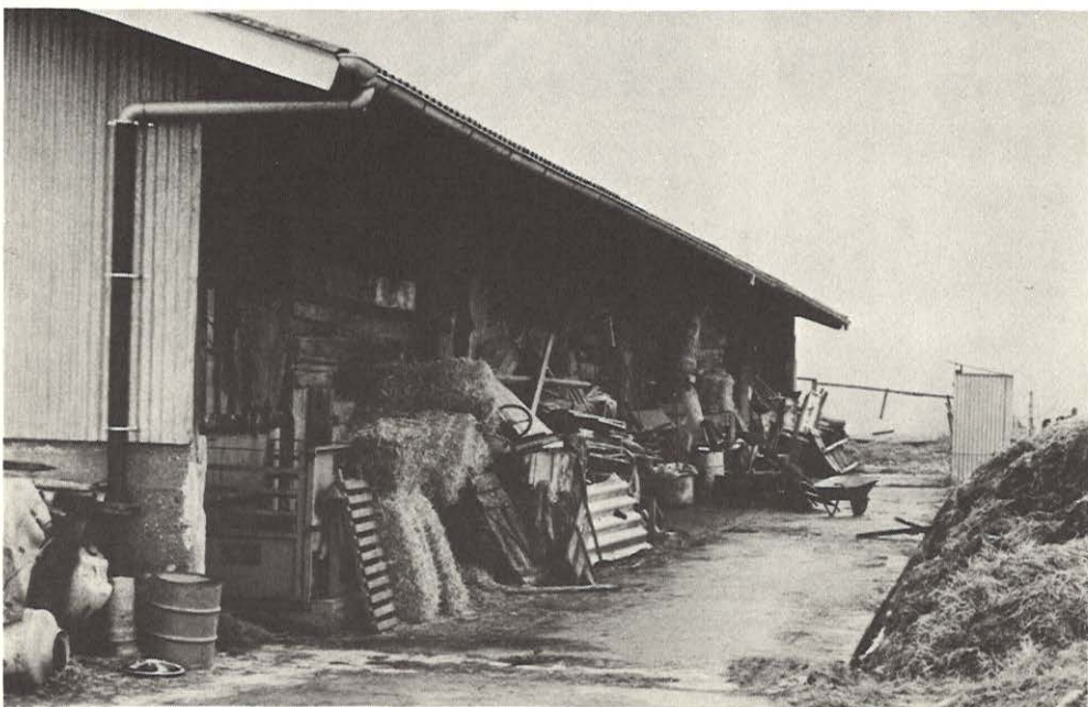
3. Ce matériel agricole est exposé au bord d'un chemin partant du village. Quel chemin ?