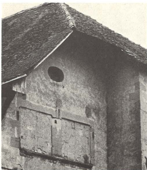
1. Rue et numéro ?