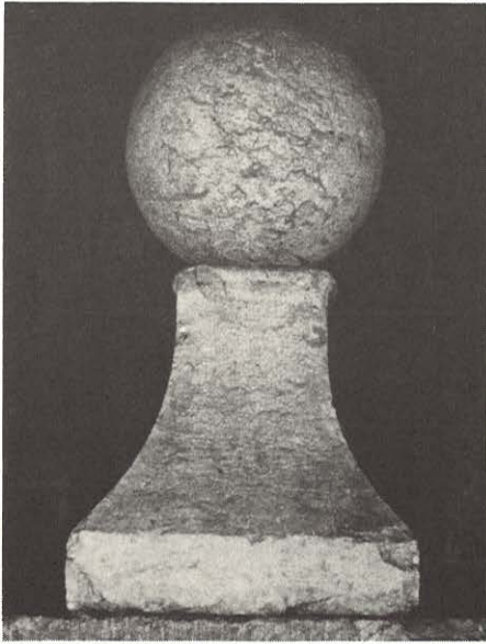
10. Où se trouve ce "monument" ?