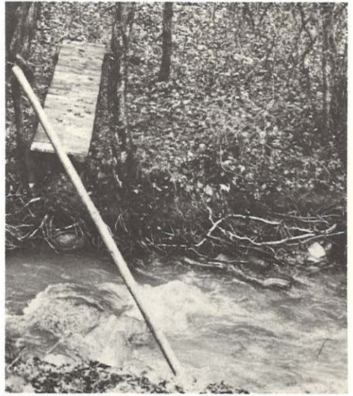
11. Quel est le nom du cours d'eau que franchit cette passerelle quand elle est en place ?